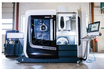
DMG MORI - DMU 50