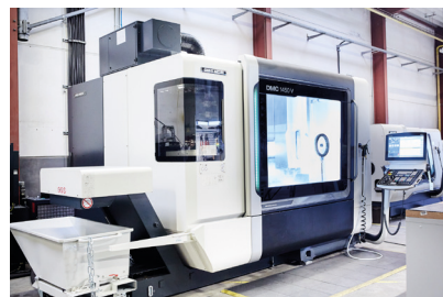
DMG MORI – DMC 1450 V