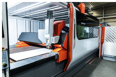
Bystronic – ByStar Fiber 12 kWPRO