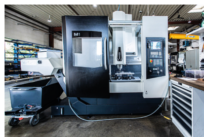
DMG MORI - M1