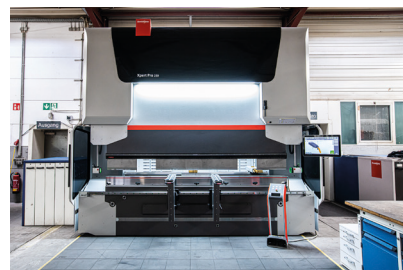
Bystronic – Xpert 250 PRO