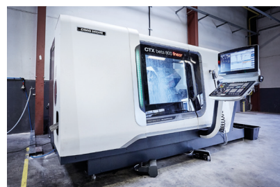
DMG MORI – CTX beta 800 linear